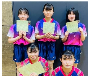
女子3・4位トーナメント優勝 神戸山手女子 C