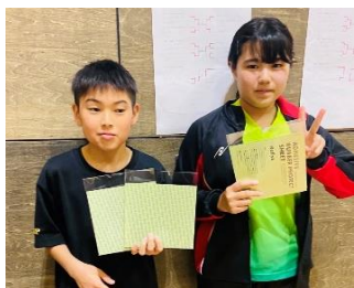
男子5・6位トーナメント優勝 平ジュニア B