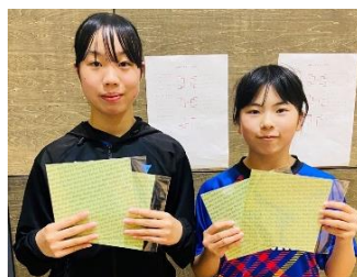
女子3位 コンパスクラブ神戸 C