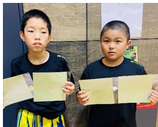
男子3・4位トーナメント優勝 PON卓 B