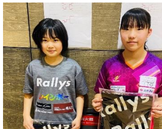
女子準優勝 イトウTTC A