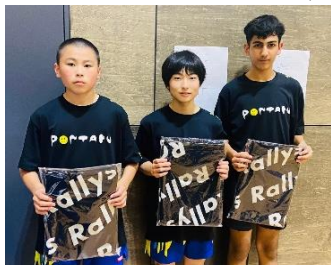
男子準優勝 PON卓 A