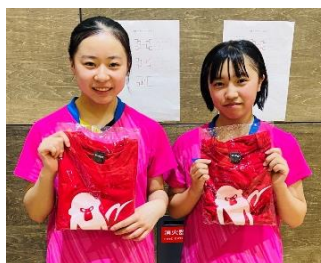
女子優勝 コンパスクラブ神戸 A