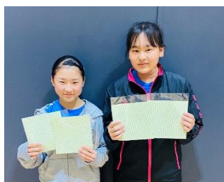
女子3位 イトウTTC B