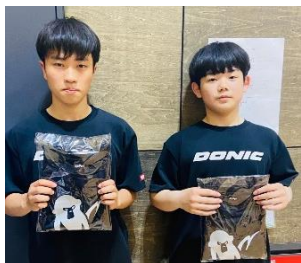
男子優勝 イトウTTC A